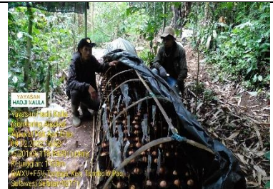
Biji yang disemai dan yang sudah disambung Pucuk Poktan Parang Tajjuru Gowa