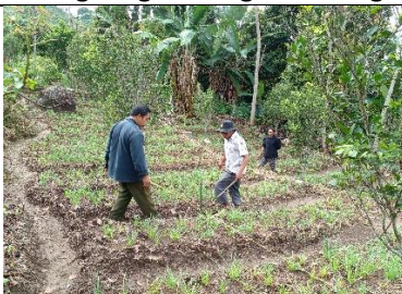
Pembuatan Blok Pohon Induk Poktan Bangkeng Ta'bing Bantaeng