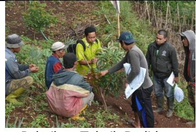
Pelatihan Teknik Budidaya (Pemupukan, Pemangkasan dan Pengendalian Hama Penyakit) Poktan Parang Tajjuru Gowa