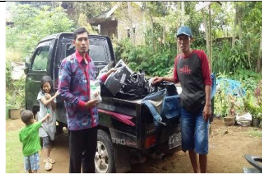
Pemberian Saprodi Poktan Parang Tajjuru Gowa