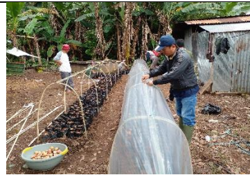
Persemain Biji Alpukat Poktan Bangkeng Ta'bing Bantaeng