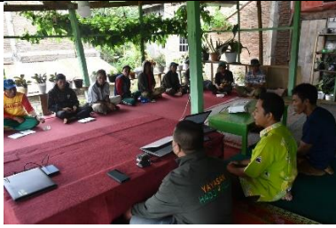
Pelatihan Teknik Budidaya (Pemupukan, Pemangkasan dan Pengendalian Hama Penyakit) Poktan Parang Tajjuru Gowa