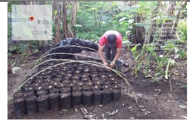
Persemain Biji Alpukat Poktan Parang Tajjuru Gowa