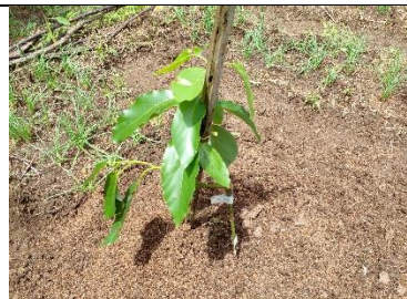
Penanaman Pohon Induk Alpukat Poktan Bangkeng Ta'bing Bantaeng