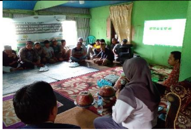
Pelatihan Teknik Budidaya (Persiapan Lahan) Poktan Bangkeng Ta'bing Bantaeng