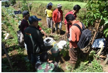
Pelatihan Teknik Budidaya (Pemupukan, Pemangkasan dan Pengendalian Hama Penyakit) Poktan Parang Tajjuru Gowa