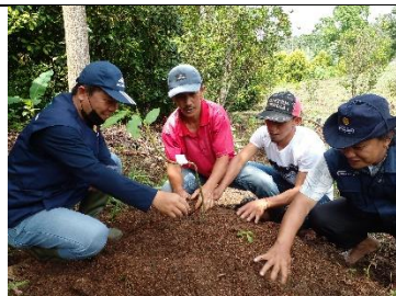
Penanaman Pohon Induk Alpukat Poktan Bangkeng Ta'bing Bantaeng