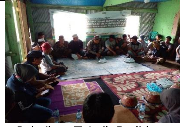
Pelatihan Teknik Budidaya (Persiapan Lahan) Poktan Bangkeng Ta'bing Bantaeng