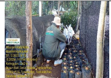
Biji yang disemai dan yang sudah disambung Pucuk Poktan Parang Tajjuru Gowa