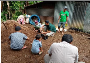
Pengisian Polybag untuk persemain biji alpukat Poktan Bangkeng Ta'bing Bantaeng