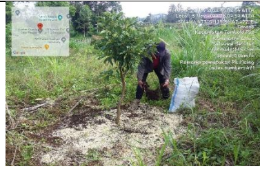
Pemupukan Tanaman Alpukat Poktan Parang Tajjuru Gowa