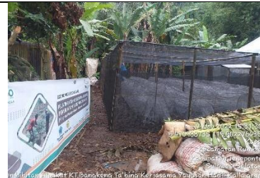
Persemain Biji Alpukat Poktan Bangkeng Ta'bing Bantaeng