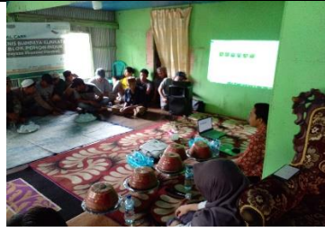
Pelatihan Teknik Budidaya (Persiapan Lahan) Poktan Bangkeng Ta'bing Bantaeng