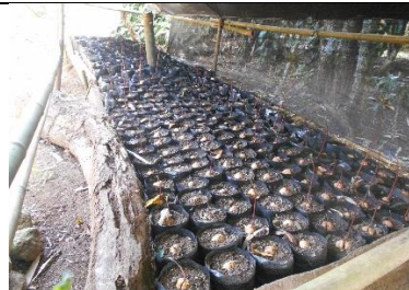
Persemain Biji Alpukat Poktan Parang Tajjuru Gowa